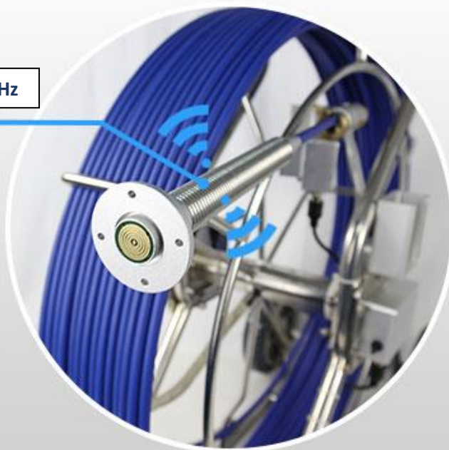
TRANSMISSOR 512 Hz