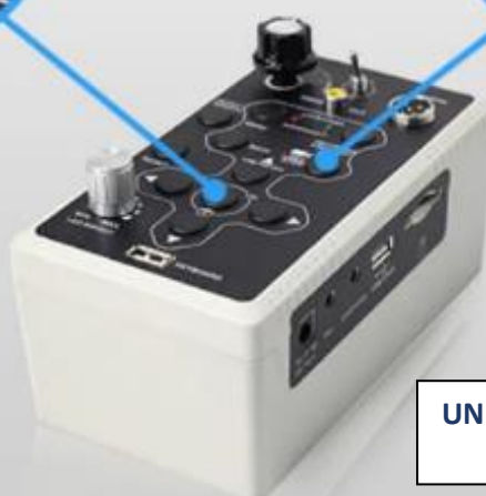
UNIDADE DE CONTROLE E GRAVAÇÃO